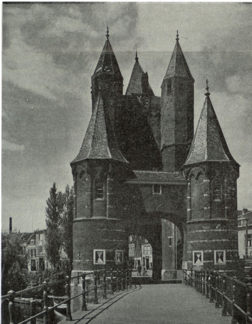
Amsterdamsche poort te Haarlem

Mag ik zeggen, wat ik voor mij het sterkst zie als de algemeene eigenschap van den Nederlander? Een eigenschap, die wel zeer sterk samenhangt met het land, dat zijn vaderland is? Het is de wil om er te komen en om er te blijven, die zich in de besten van ons volk altijd weer openbaart. „Ons daar de wake, het weren, het werken,” zooals het vaandellied het uitdrukt. Die wil om er te komen en om er te blijven, zie ik overal. Ik vind die in onze groote droogleggingen van vroeger en van nu. In de Haarlemmermeer evengoed als in de Wieringermeer en het groote werk van den afsluitdijk. Ja, eigenlijk in het kleinste dijkje van ons land, dat diende om het land aan de zee te ontrukken en om dat eenmaal verkregen land te behouden. Ik zie het in het werk op de zware klei en in de ontginningen op de hei. Ik zie het in scheepvaart en industrie. De wil om een plaats te