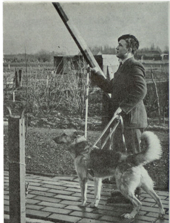
Een slagboom moet gepasseerd worden. De „herder” heeft zijn meester gewaarschuwd.