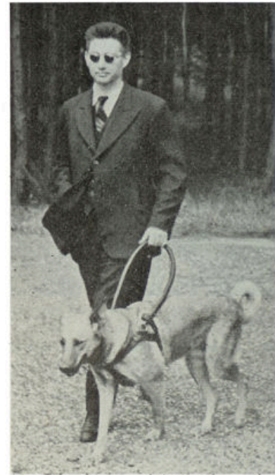
Op weg door de bosschen

Er moeten nu eenmaal aan de dieren bepaalde eischen gesteld worden, waarvan allereerst genoemd zij de leeftijd, welke van 1 jaar tot ten hoogste 2½ loopt. Na het tiende jaar wordt de hond alleens minder geschikt om als geleider op te treden. Een bepaald ras is niet zoozeer van noode: men ziet (in een ruime kennel met modelnachtthokken) herders, St Bernardshonden, bouviërs e.a. Elke hond komt veertien dagen