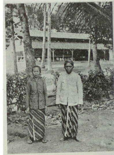
De vader en moeder van Blondo.

Vrouwen zijn bezig de eigen gebakken dakpannen, heel primitief vervaardigd van aarde, die men vlak bij de hand heeft met een vuurtje onder de vormen — te witten. Want inplaats van de atapidakbedekking worden tegenwoordig zooveel mogelijk dakpannen en helaas ook dikwijls gegolfd ijzeren platen of platgeslagen petroleumblikken gebruikt, die het landschap nu juist geen pittoresker aanzien geven. Dit alles ter bestrijding van de pest, daar de atap veel ratten bergt en met hen veel