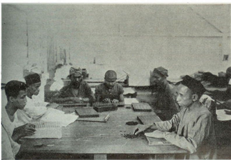
Gezamenlijk aan 't werk.