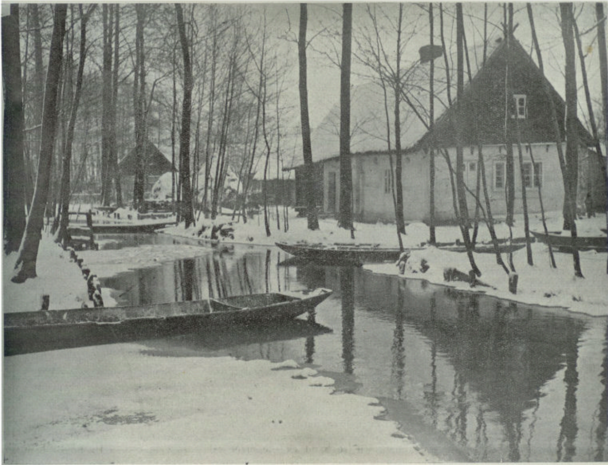
In den greep van den wintervorst.