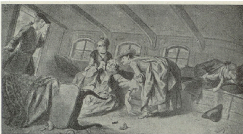
Illustratie uit Ferdinand Huyck

De bekende historische romans als „De Pleegzoon” (1829), „De roos van Dekama” (1836) hadden een breed lezerskring gevonden, maar „Ferdinand Huyck” sloeg beide boeken met lengten. En „Ferdinand Huyck” verdiende dat ook. Het verscheen in den zomer van 1840, en de groote, gezaghebbende criticus van de negentiende-eeuw, Busken Huet, schreef van dit werk: „Een door en door minzaam boek, zoo frisch als