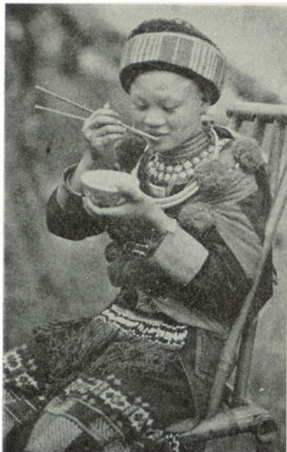
Chineesch meisje aan den rijstmaaltijd.

Veel langzamer dan wij wel zou- den willen, bereiken ons de be- richten van de Christelijke Kerk in China. Het oorlogsgeweld neemt ook in het Hemelsche Rijk de eerste plaats in. Vele Christelijke gemeen- ten zijn uit elkaar geslagen en ver- spreid. Onnoemelijke schade is aan- gericht, die in geen tientallen jaren kan worden hersteld.