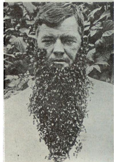
Een Amerikaan, die naar zijn eigen zeggen geen last heeft van bijensteken en dat bewijst door een heele zwerm bij wijze van baard aan zijn kin te laten hangen.

Indien deze prijswinnaars bijzondere voorliefde hebben voor een der uitge- loofde prijzen, kan dat aan de uitgevers in Zwolle worden meegedeeld. Met wen- schen zal zooveel mogelijk rekening ge- houden worden.