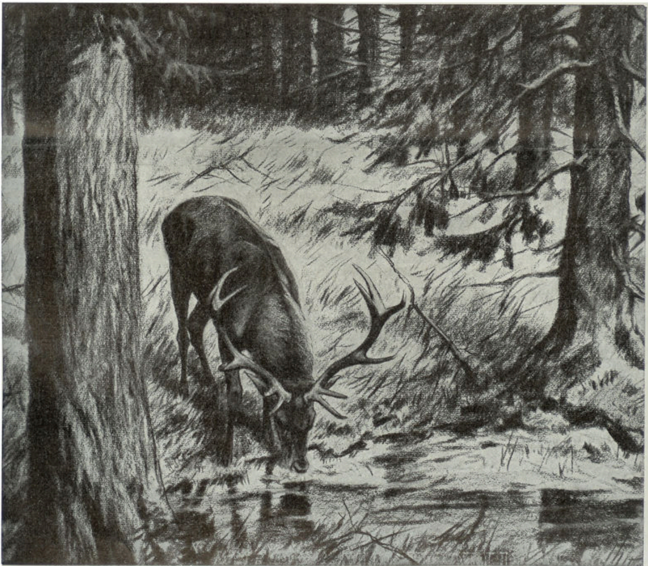
Als een hert door dorst bevangen, naar de frissche sprengen hijgt....

Deze begenadigde dienaar, die thans is ingegaan in de vreugde zijns Heeren, mocht zeer velen — ook door zijn vele boeken, geschriften en „Pniël” — den weg wijzen ten hemel. Het Evangelie was voor hem de hoofdzaak. Hij verkondigde: „Jezus Christus en Dien gekruist.” Hoe dikwijls schreef hij het neer: „Geloofd zij Jezus Christus!”