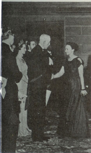
Koning Gustaaf overhandigt den Nobelprijs aan mevr. Joliot, dochter van mevr. Curie.

Wat we weten is dit: hij was een man van zeldzame gaven van hoofd en hart. Byron kende hij hij wijze van