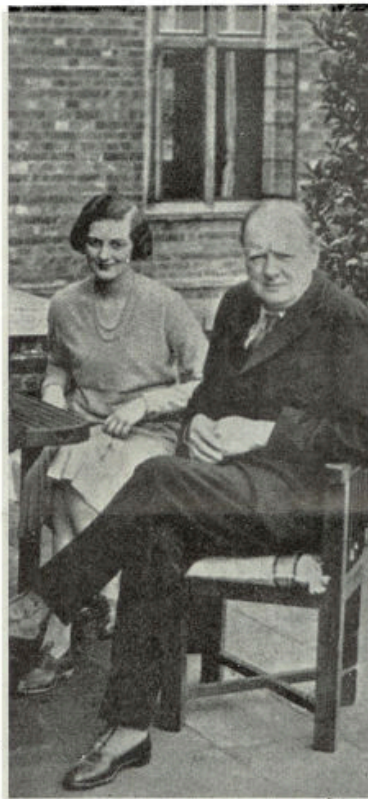
Churchill met zijn dochter Diana

de keizer tijdens die onderhandelingen weer een van zijn onvoorzichtige redevoeringen hield, bleven die onderhandelingen voortduren. Toen Engeland echter de clauseule weigerde te aanvaarden, waarin stond, dat het tenminste een welwillende neutraliteit zou eerbiedigen, wanneer Duitsland tot een oorlog mocht worden gedwongen, liep het