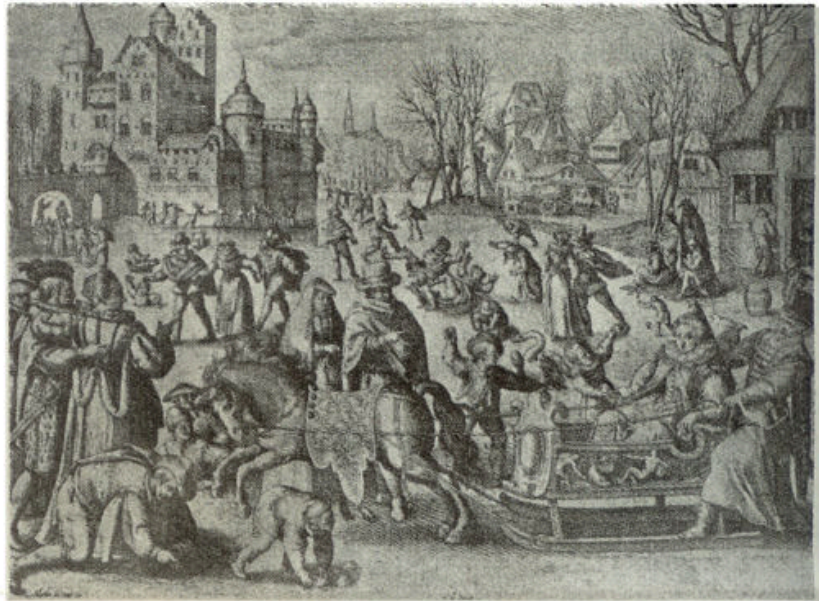
Ijsvermaak in vroeger eeuwen

Met twee sterke, forsche paarden voor den holderwagen gespannen,