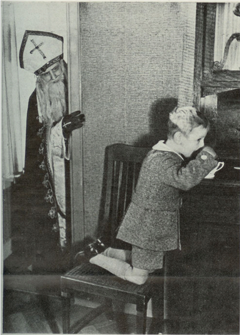
Op heeterdaad betrapt

Stadhouders, die een kleinzoon „mocht beleven” en hij verzekerde de heeren, dat de jonggeborene — indien God zijn leven spaarde — zou worden opgevoed „in de beginsels van vrijheid en godsdienst, de beide zuilen van ons Gemeenebest.” Nimmer had Den Haag een vroolijker Sinterklaasdag beleefd dan dien van 1792. Een teekenaar voelde zich geïnspireerd tot het teekenen van een plaat, waarop Sint Nicolaas in hoogst eigen persoon de hoofdrol speelt. Deze toch legt de Nederlandse Maagd, bij wijze van Sint Nicolaasgeschenk, het kleine Oranjeprinsje in de armen. Ook de dichters lieten zich niet onbetuigd. Het sprak vanzelf, dat de dichter-Oranjeklant Mr Willem Bilderdijk in zware tonen z'n vreugde bezong in een toespraak, die hij tot het Prinsje