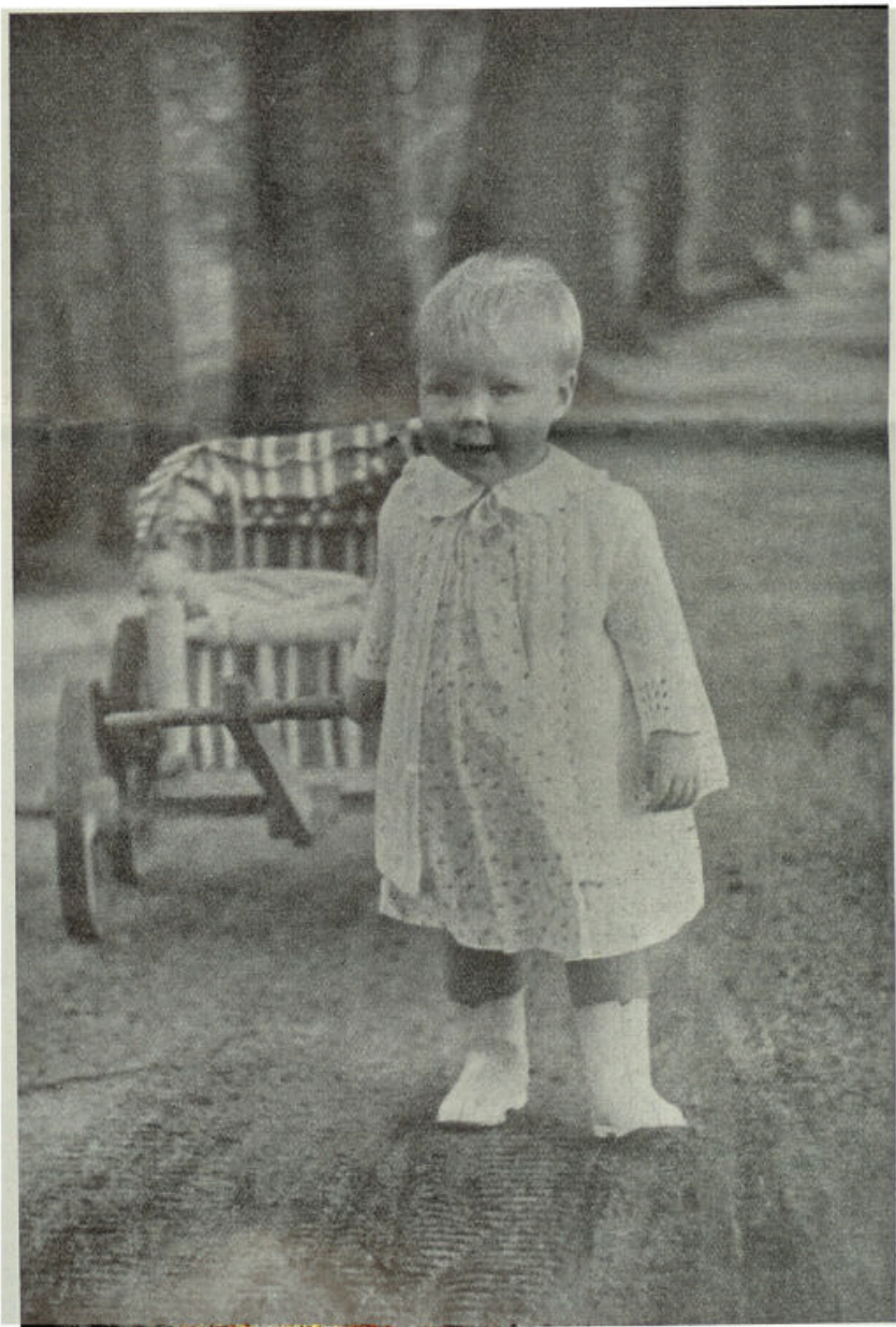
31 Januari 1940

Datzelfde zeggen wij van onze prinses Beatrix!