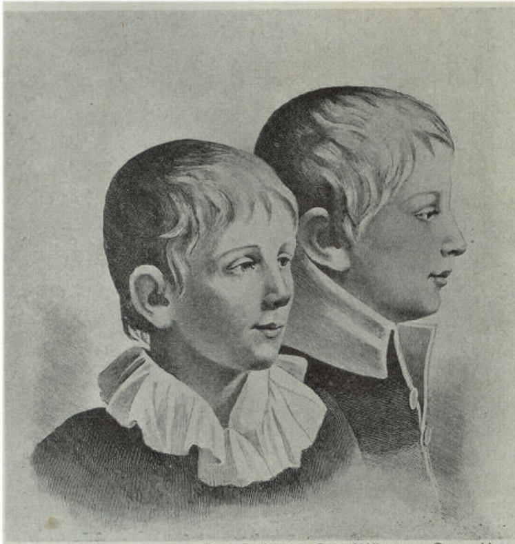
Prins Frederik en Prins Willem van Oranje Nassau

Toen Prinses Louise, de dochter van Prins Willem V, haar broer te Berlijn bezocht, hadden de beide Prinsjes Willem en Frits, zes en vier jaar oud, mee aan tafel gegeten.