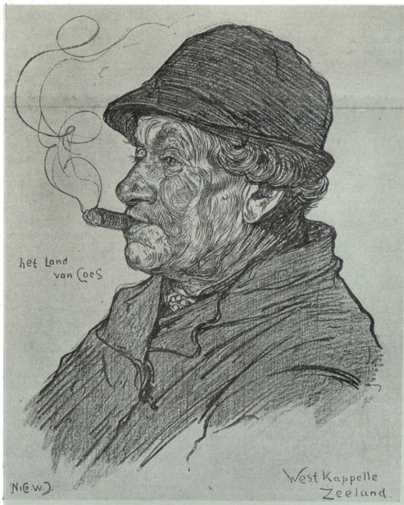
Een volkstype uit de provincie, die het ook zoo zwaar te verantwoorden had in de dagen, die achter ons liggen.