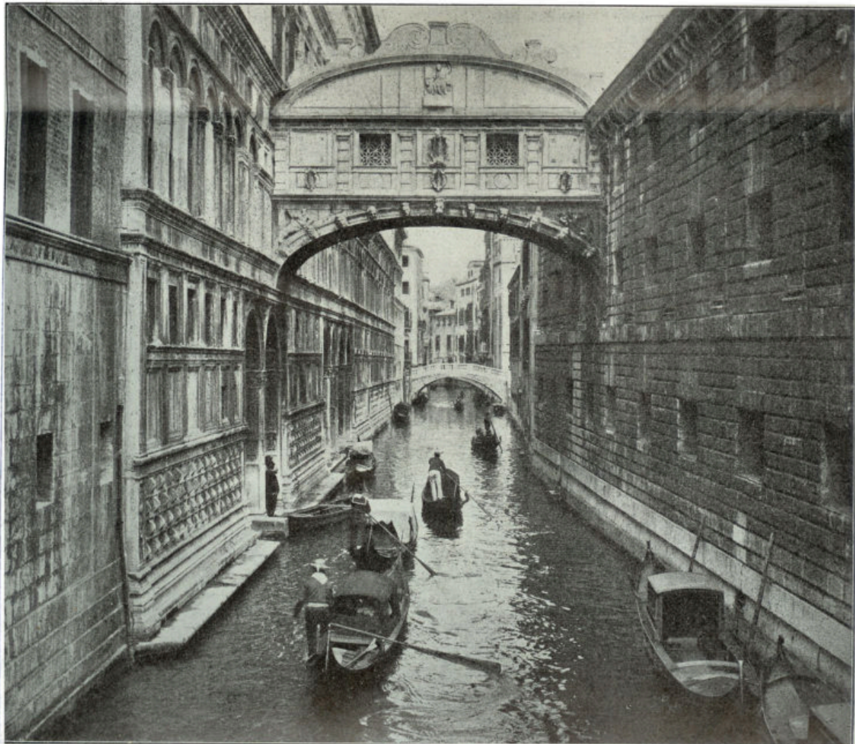
Cliché Rotterdamsche Lloyd

De nacht hangt dicht over boomgaarden en tuinen; de sterren bloeien schaars in de donkere lucht. 't Is een Meinacht, die groei geeft. Geur stroomt van al de bloesemende takken in de hoven rondom, ook in Domi's tuin.