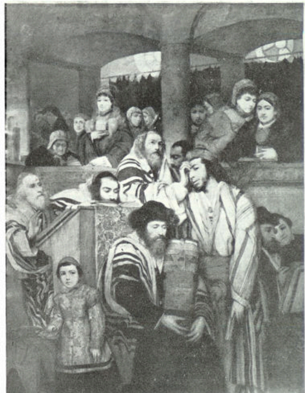
BIDDENDE JODEN. Naar een schilderij van den overleden Poolschen schilder Moritz Gottlieb, dat thans in het museum te Tel-Aviv hangt. Het mooie doek is gemaakt in 1878.

Zoo maakt men van deze wrakken nog nuttige menschen, terwijl de besten onder hen soms naar Midden-Celebes emigreeren om daar op de kolonie van het Leger te Kalawara tot landbouwer te worden opgeleid en eindelijk zelfs in het bezit van een eigen huisje en een eigen stukje land te komen. Dat waren de menschen, die tevoren soms bedekt met afzichtelijke wonden op de „passar”, de Inlandsche markt, zaten en bedelend hun hand ophieven, die soms tegen hun zin door de politie in Boegangan werden gebracht, omdat ze noch voor den dokter, noch voor werken voelden, maar die langzamerhand, onder de voortreffelijke leiding van de geduldige officieren en hun helpers, geestelijk en lichamelijk nieuwe menschen werden.