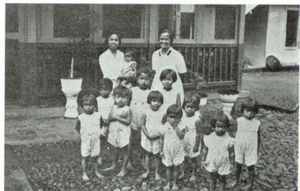
Kinderen der melaatsche kolonisten te Pelantoengan

In 't Ooglijders-Hospitaal te Semarang werden 774 patiënten opgenomen en verpleegd met 41.223 verpleegdagen.