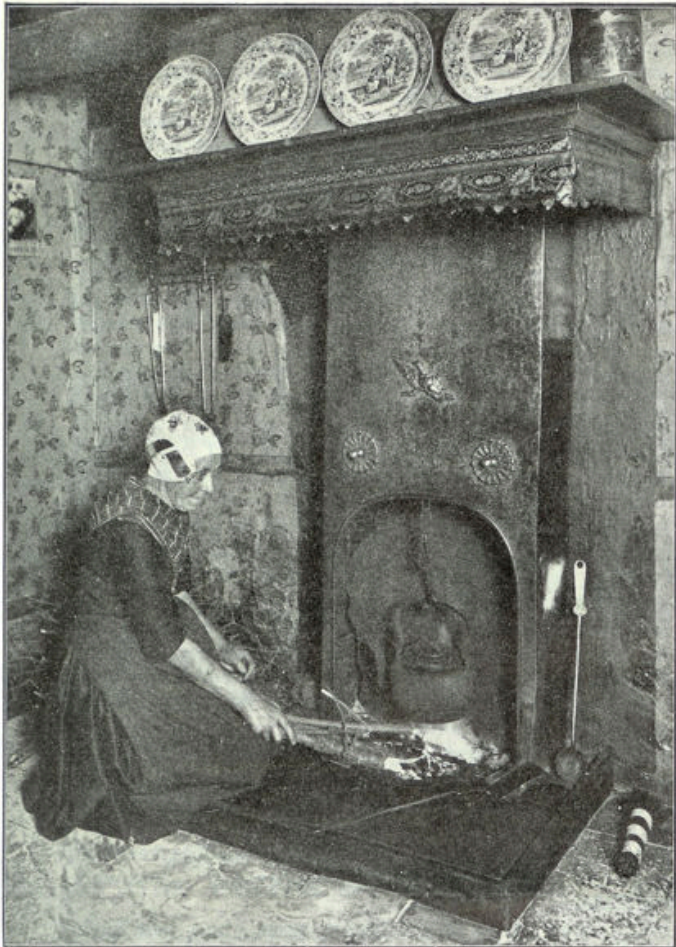
Cliché Rotterdamsche Lloyd