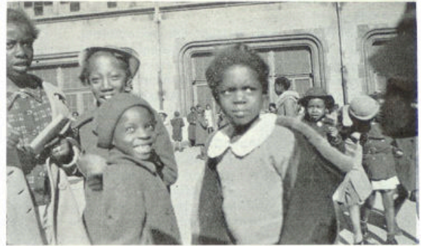
Een kiekje, op de speelplaats gemaakt.

Als de kleine klanten hun keuze gedaan hebben en een blik hebben geslagen in hun beursje, stappen ze naar den stapel ijzeren blaadjes, waarop eetgerei in een papieren servetje gewikkeld klaar ligt en dan naar het buffet, waar vrouwen bezig zijn het eten uit te delen. Deze staan in dienst van de stad, die ook hun salarissen uitbetaalt, want met hetgeen de kinderen voor het eten geven moeten, is slechts de kostprijs ervan voldaan. De gemeente legt dus aanzienlijke bedragen bij, want alle