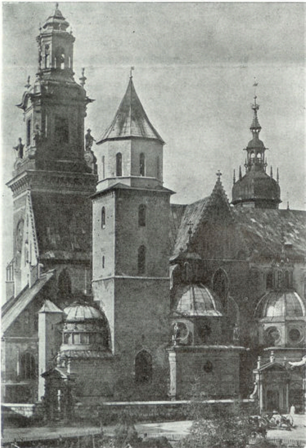
Het kostbare architectonische kunstwerk van Krakau, de Kathedraal. Achttien kapellen omringen het Domgebouw, waarin de graf-tomben van machtige en aanzienlijke Polen geborgen zijn. Ook maarschalk Pilsodski werd er bijgezet.