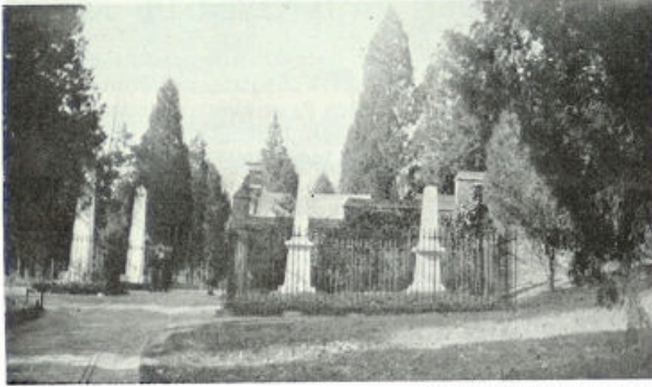
Graf van Washington