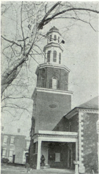
Het kerkje van George Washington

Het gebouwtje is al bijna vol als ik binnentreed, toch krijg ik nog een goede plaats. Maar dan zie ik iets heel eigenaardigs. Links van me in het midden der witte banken is een afdeeling van twee banken tegenover elkaar. Er zit een rij menschen met het gezicht naar den kansel, zooals iedere kerk dat heeft, maar de rij er tegenover zit met den rug erheen, kan den dominee zelfs niet zien, en doet daarom den heelen morgen niet anders dan hinderlijk de andere menschen in het gezicht zien. Het is iets heel dwaas en echt Amerikaansch. Want wat is het geval? Die kleine afdeeling is de familiebank van