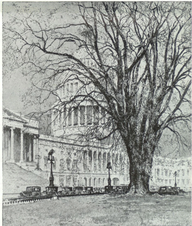
Het prachtige Kapitoel in de hoofdstad Washington

Heel ernstig is de stem van den neger, terwijl hij de enkele bezoekers uitleg geeft, hij doet het met groote piëteit. Dichtbij zijn nog enkele graven, verborgen onder witte zerken en rondom rijzen vier witte zuilen op. Wind ruischt door de oude boomen boven onze hoofden, dorre bladeren ritselen op het pad en als de stem van den neger zwijgt, heerscht er een diepe stilte. Men voelt de doodscheid van den winter varen door de doordringen-