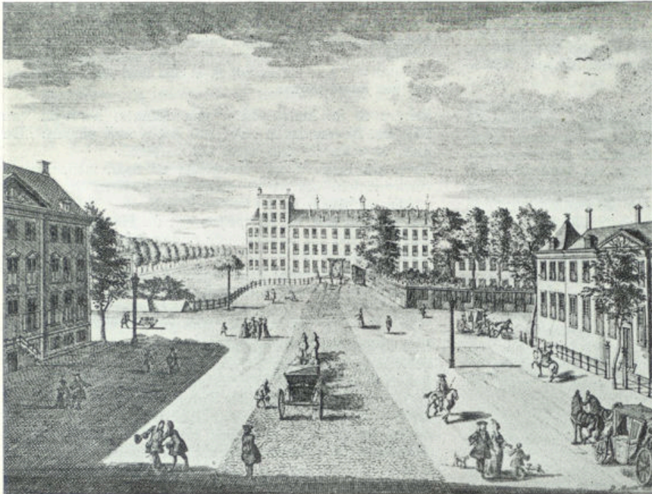
Het BUITENHOF met gezicht op het Stadhoudelijk kwartier, omstreeks 1782.