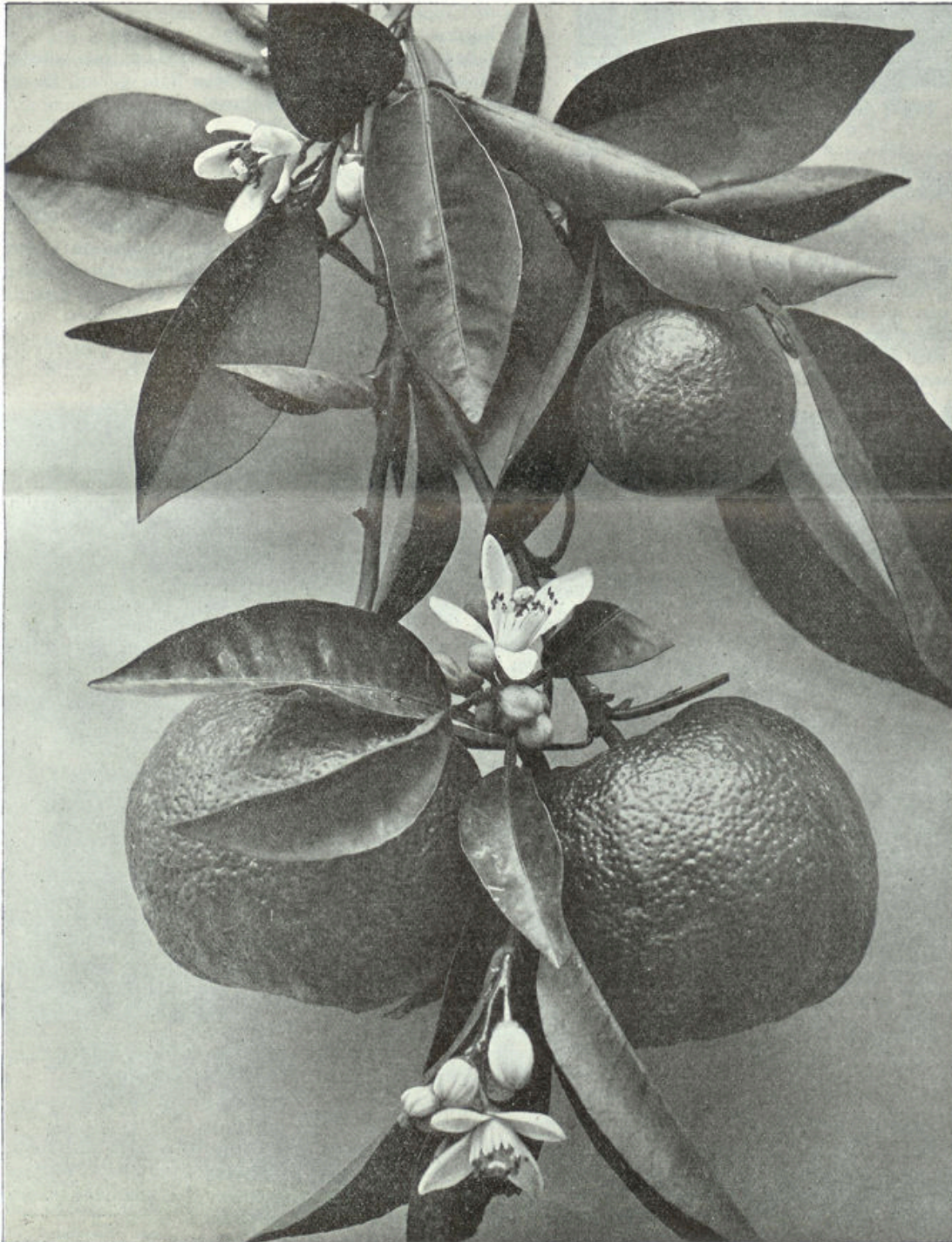
De Oranjeboom in bloei.