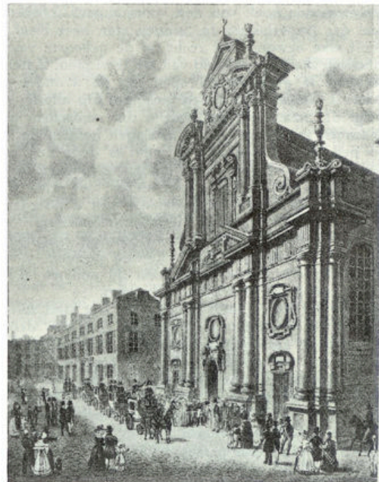
De Augustijnerkerk te Brussel, waarin Prins Casimir werd bijgezet.