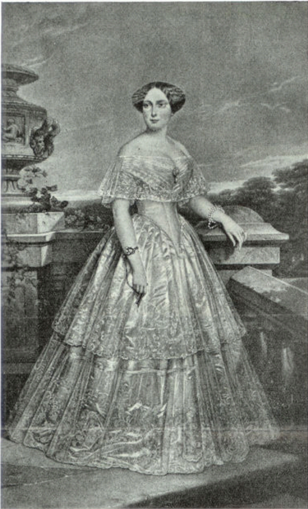
Prinses Louise, op 5 Augustus 1828 geboren.