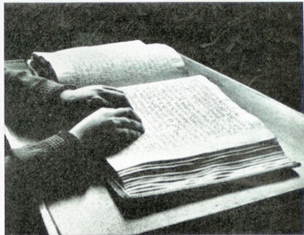
Het lezen van blindenschrift