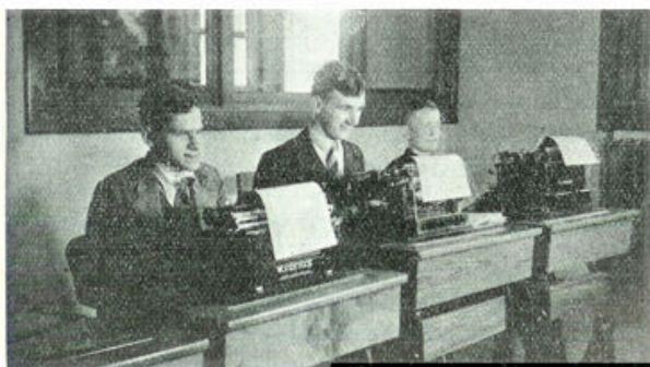
Kantooropleiding voor blinden

Zoo zijn er meer zaken, die blinden op hun kantoor in dienst hebben o.a. de houthandel Jongeneel te Utrecht en de hoogovens te Velzen, zeer tot hun tevredenheid. Daar kan de blinde zelfstandig werken en in zijn eigen onderhoud voorzien. En de enkele blinden, die in het bezit zijn van een geleidehond, zijn daarmee totaal onafhankelijk geworden van het twijfelachtige medelijden van hun medemensch. Ja, ik zou hier de vraag willen stellen: kunnen we hier nog spreken van onvolwaardige arbeidskrachten?