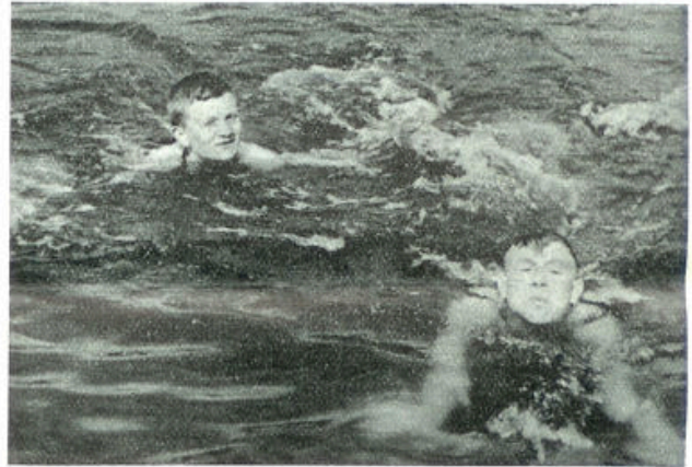
Blinden in het water

Maar ook voor den normalen blinde is er een groote verscheidenheid van gave. De een kan beter met zijn handen werken, een ander beter met zijn hoofd. Als handwerkvakken zou ik willen noemen: het maken van manden, borstels, matten, stoelzittingen enz. waarmee een handige werker in de werkinrichtingen zijn eigen brood kan verdienen.