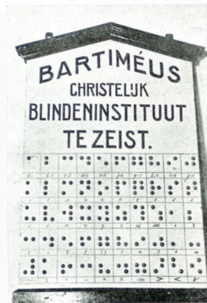
Het braille alfabet

Niet voor niets noemt de wet als eerste vak, waarin onderwijs gegeven moet worden: het lezen, want dit is de poort, die toegang geeft tot een groot aantal andere vakken. Wie lezen kan, zou desnoods alleen geschiedenis, aardrijkskunde, plantkunde, enz. kunnen leeren. Deze kwestie is voor de blinden op een geniale wijze opgelost door Louis Braille (1806—1852), die zelf ook blind was. Men probeerde eerst de „ziende" letters voelbaar te maken, door ze in relief in 't papier te slaan,