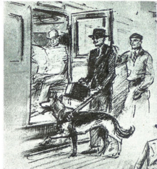
Een paar trouwe hondenogen zijn altijd bereid.

Een dagelijksche gymnastiekles, waarbij goed acht ge-