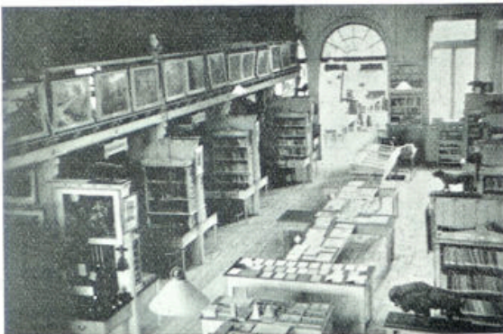
Een overzichtsfoto van de groote zaal, op den achtergrond de leeszaal.