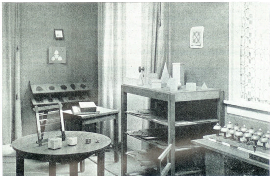
In het domein van Dr Maria Montessori

zij die door hun beroep 't onderwijs (voorbereidend, lager, middelbaar en gymasiaal) dienen, kunnen in de allereerste plaats deze instelling ten volle waardeeren, en 't belang er van beseffen voor de school en voor zichzelf. Want voor de school kan men hier een keus doen uit een vrijwel complete verzameling van de nieuwe (en ook oudere) boeken, leer- en aanschouwingsmiddelen en schoolmeubelen. En voor zichzelf hebben ze hier studiemateriaal in overvloed. Maar de school is niet enkel en alleen 'n terrein waar de vakman werkt, 't is ook de plaats waar het jonge geslacht wordt ontwikkeld en gevormd, waar men wordt voorbereid voor