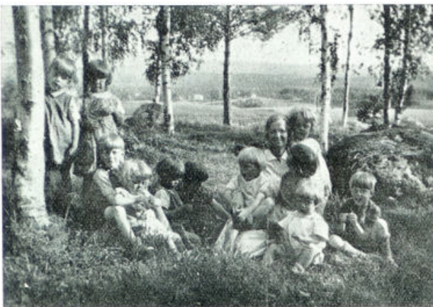
Een kijkje in een kinderkolonie