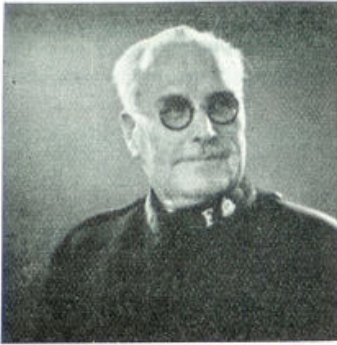
Brigadier Axel Lindahl

In 1894 begon men den arbeid onder doofstommen en blinden, men zond pioniers naar Noorwegen en Finland, en in 1897 gingen reeds de eerste missionarissen naar Indië en Zuid-Amerika. En nu bezit het Leger in Zweden duizenden soldaten en honderden toegewijde officieren. Tot zelfs in het hooge