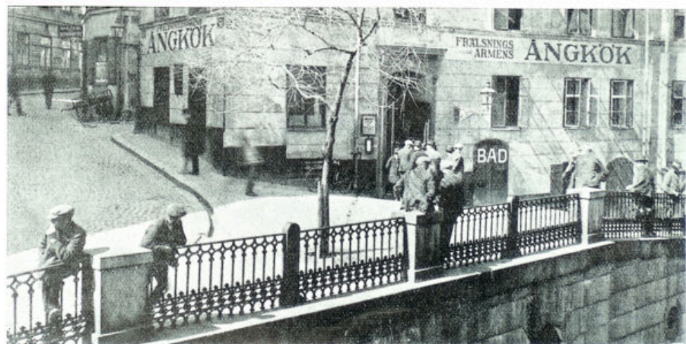
Het huis voor de mannen

Van dat schuchtere begin af ging het steeds Excelsior, in Gods kracht en gedreven door de liefde van Christus.