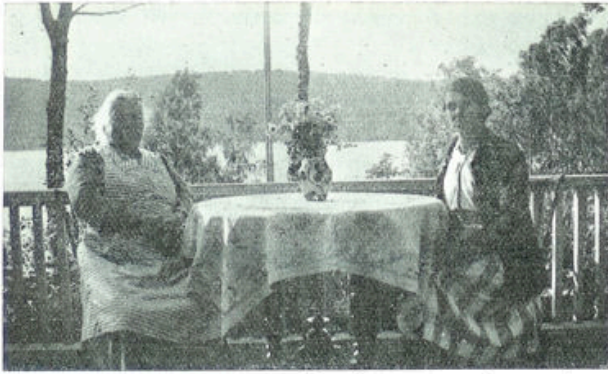
Zomerhuis voor ouden van dagen