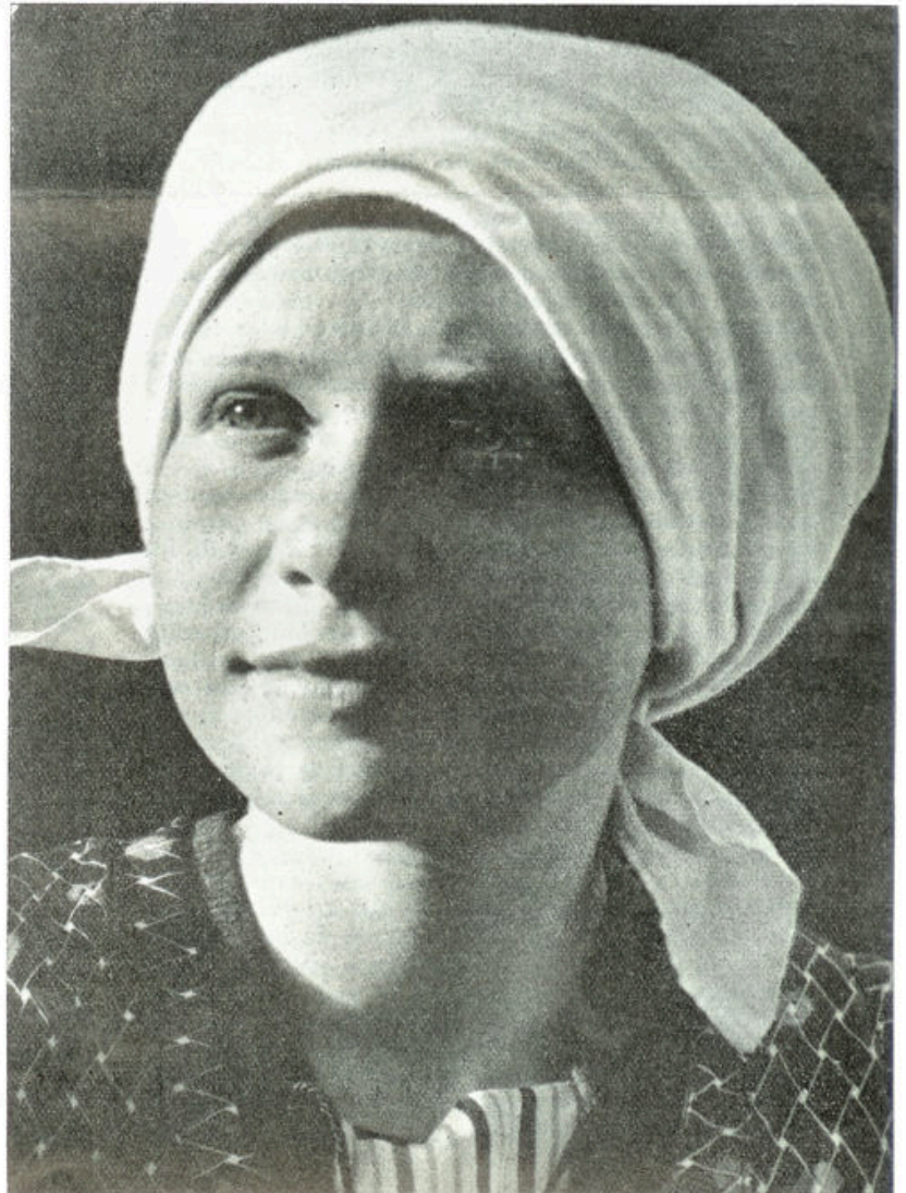
Jonge vrouw uit Limburg