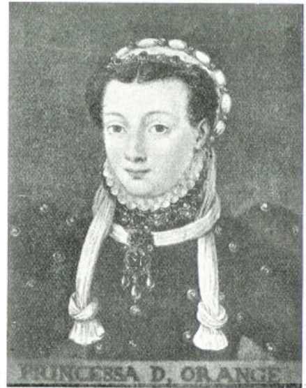
Anna van Oranje-Nassau

Ze kennen als jonkvrouwen 's levens licht en donker — ze voelen de