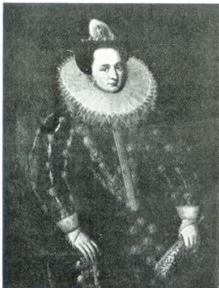
Maria van Oranje-Nassau

En dat dit boek boeit, is te danken aan deze deugd, dat het de verschillende personen voor ons doet leven. De auteur heeft zich het leven dezer prinsessen ingedacht,