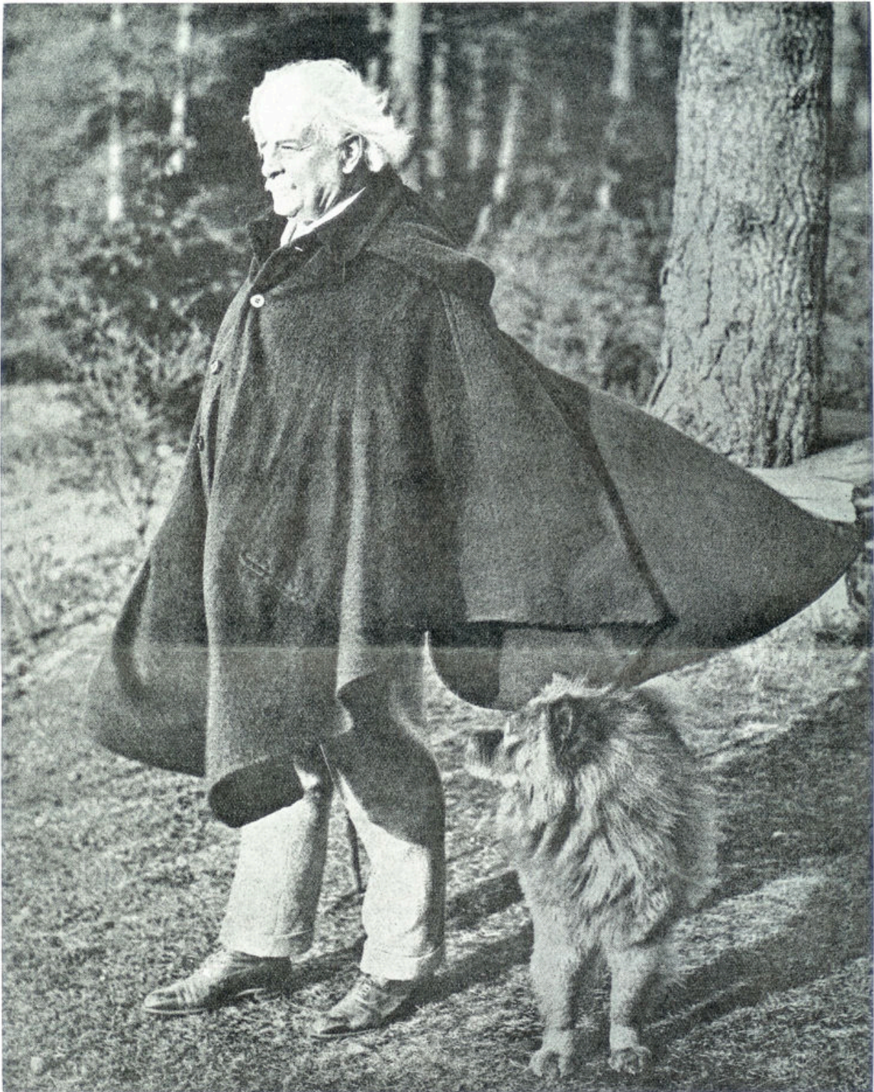
DE KLEINE TOOVENAAR LIIT WALES