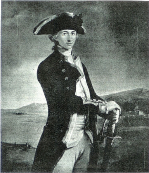
Horatio Nelson op den leeftijd van 22 jaar