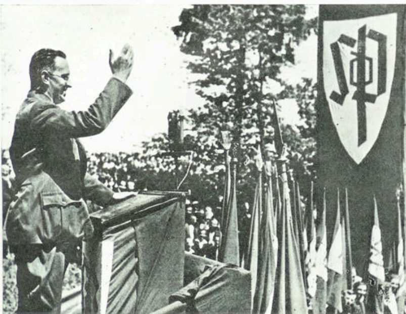
Henlein houdt een rede in het Sudeten-Duitsche gebied