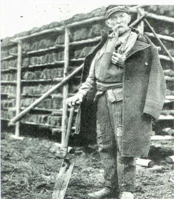
Een rasecht type uit het Sudetengebied

Het laat zich denken, dat die verhouding er niet beter op werd, toen in 1918 de rollen werden omgekeerd en de