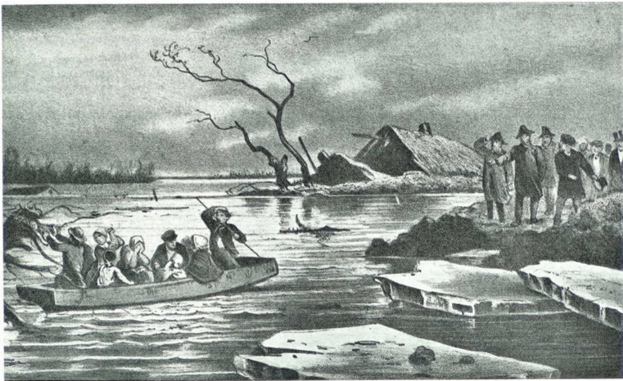
Koning Willem III temidden van een overstromingsramp