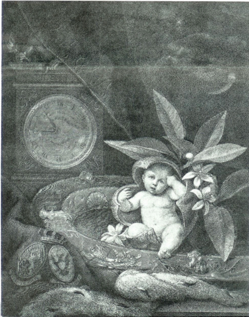
Allegorische voorstelling der geboorte van den erfprins van Oranje, onzen lateren Koning Willem III.

Als „spruit van vijftig helden” had de koning heldenbloed in de aderen, en zou hij zich gaarne persoonlijk hebben onderscheiden. In het kamp van Zeist ontviel hem dan ook eens dit schampere woord: „Ik heb enkel maar los kruit geroken,” en er klonk iets spijtgigs in den toon, waarop hij dit zeide. Juist hij werd een vorst des vredes bij uitnemendheid en in de kritieke jaren 1866 en 1870 was het zijn hoogste eer, zijn land voor het oorlogsgeweld te kunnen bewaren. Geen vorst was ooit zoo beziel met het verlangen het goede voor zijn volk te zoeken als juist Koning Willem III en toch, welk vorst zag zooveel rampen over dat volk komen als juist hij?