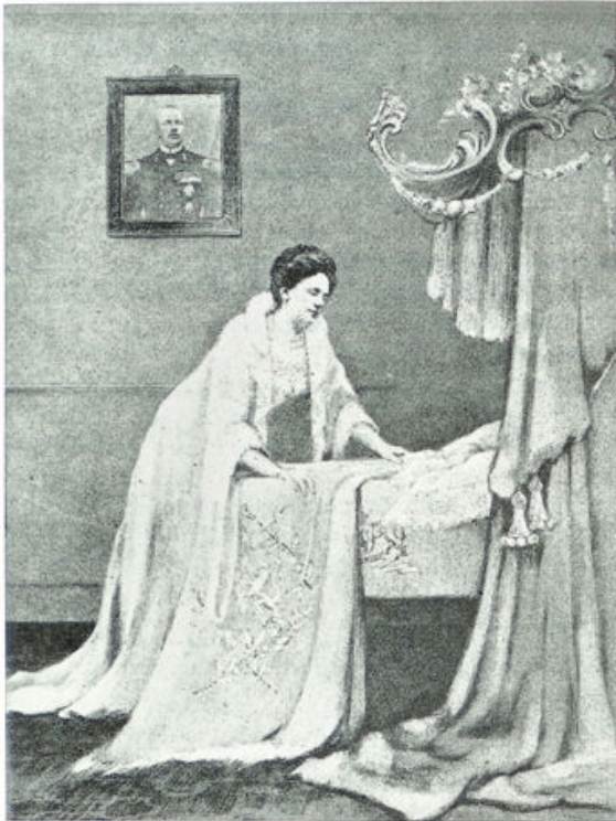
Een voorstelling van ongeveer 29 jaar geleden toen de Koninklijke blijde gebeurtenis in het Haagsche paleis zulk een stormachtige vreugde in geheel het land bracht.