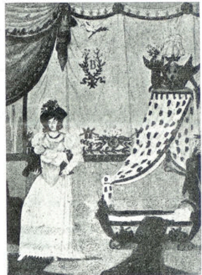
„De min was een personage van gewicht...“

De koninklijke zuigelingen staken „in 't pak“ — dat sprak toen trouwens van zelf; de gedachte aan vrijheid van beweging voor een jonggeborene was nog in niemands hoofd opgekomen. Er bestaat een portretje van Lodewijk XIII, zeven maanden oud; het jongetje is van zijn halsje tot zijn voetjes in gekruiste