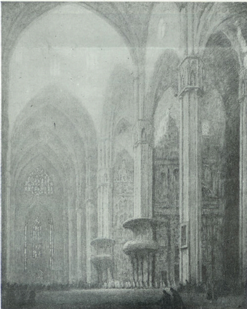
Naar een schilderij van Cossaar

Die man ziet meer dan bikhamer en steen, meer dan een stapel blokken, die weggehaald worden. Hij ziet de kathedraal. Hij ziet haar in haar massale pracht. Hij ziet haar interieur: door een kleurenrijk raam speelt de avondzon: