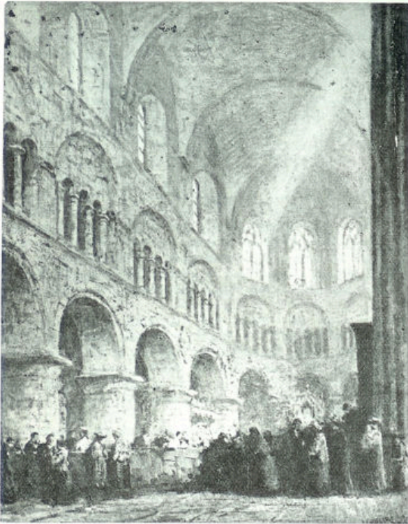
Naar een schilderij van Cossaar

het rood en het goud, het paars en het groen zingen hun lichtheid. De gewelven buigen als groote rozenbladeren naar elkander toe. Gotische bogen verliezen zich in dommeligen tempelschemer. De zuilen staan. Beeld der onwankelbaarheid. Ver weg speelt het orgel zijn Gloria in Exelsis. En daar buiten wijzen de spitsen naar de hooge stilte, naar wat hooger is dan de sterren, naar het Heilige der heiligen.