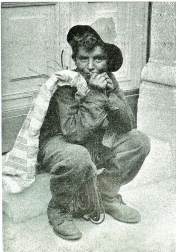
De schrik van de huisvrouw