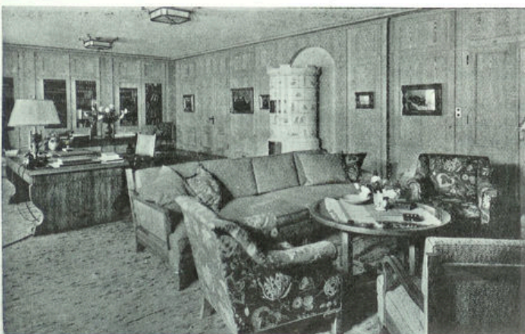
Werkkamer van Hitler