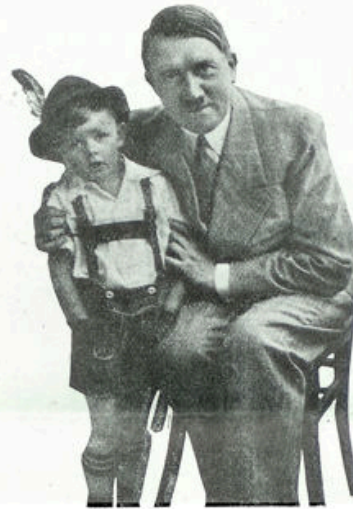
Hitler met het zontje van zijn huisbewaarder

Boven op den Obersalzberg, te Berchtesgaden, ligt „Haus Wachenfeld,” de privaatwoning van den Duitschen Rijkskanselier. Door een zadel in de bergen, die het omringen, ziet men de oude Bisschopsstad, Salzburg liggen. Bij hel-