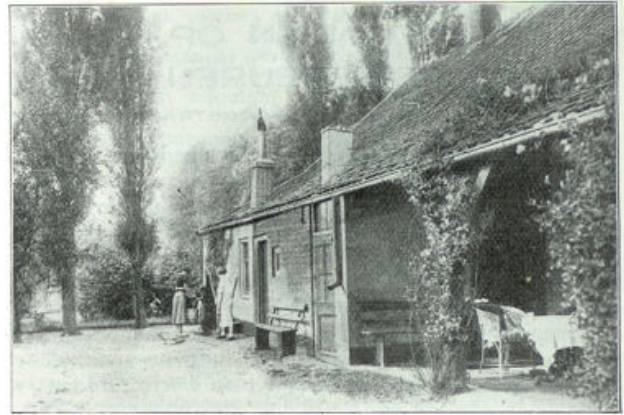
Clubhuis „de Hoeve“

's Avonds worden in de groote serre zoo af en toe causerieën gehouden voor de gasten, die daarop prijs stellen. En bij de onderlinge bespreking en het gezamenlijk lied voelt men weer de gemeenschap in Christus Jezus.