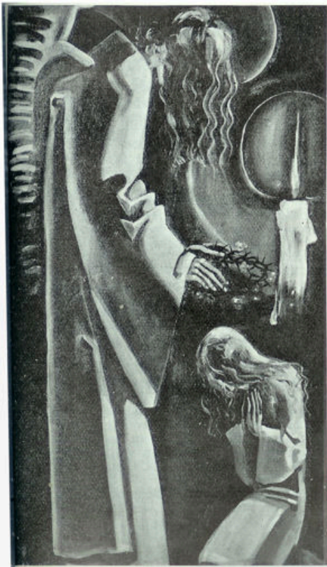
De boodschap van den engel