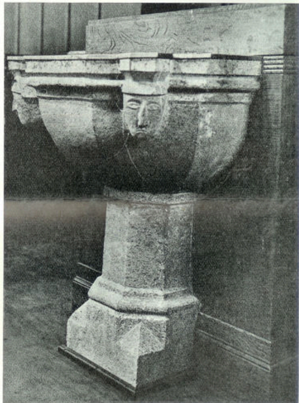
Het oud-middeleeuwsche doopvont.

Toen in 1674 Stadhouder Willem III van de Amsterdamsche, aristocratische familie de Graaff Soestdijk aankocht en er een jachtslot liet bouwen, ging hij nadien steeds te Baarn