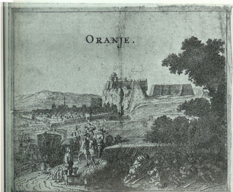
Naar een oude gravure uit het Oranje-Nassau-Museum, Den Haag