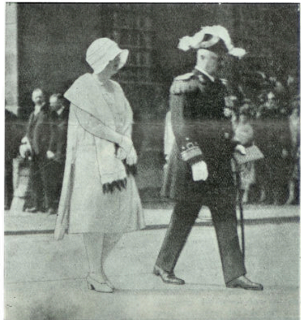
Prins Hendrik in admiraalsuniform, met Prinses Juliana

Deze belangstelling is een konsekvente voortzetting van de traditie der Oranjes.