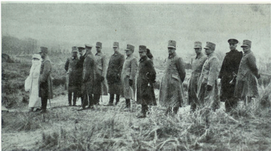
H. M. de Koningin maakt een oefening der Jagers op Waalsdorp mee