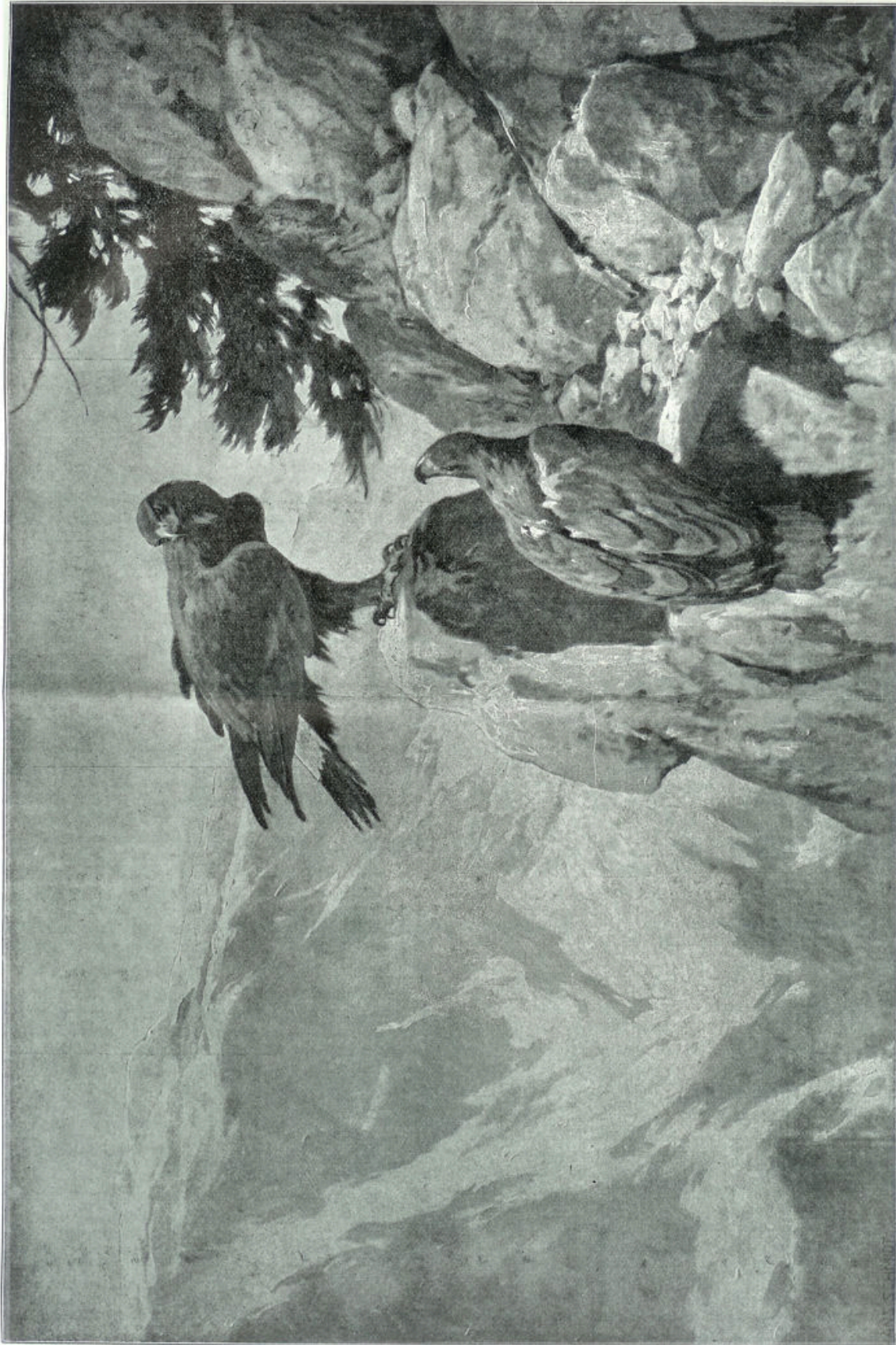
Naar een schilderij van Hans Schmidt.