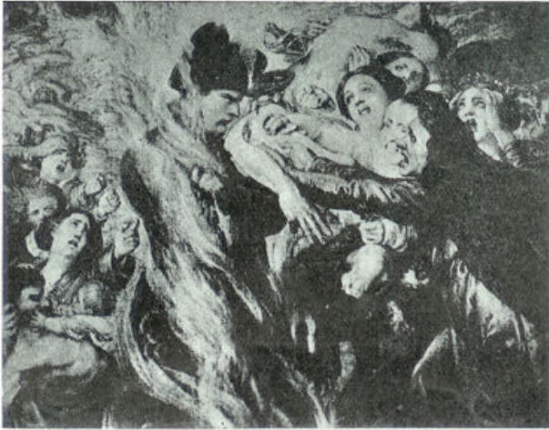
Napoleon in den gelen zwaveldamp

been alleen reeds vijf meter hoog is, zoodat hij als een bruto de wriemelende menschheid vertrappt en alles wat heilig is, edel, heldhaftig, met een ijzeren vuist verplettert. In een visie ziet hij de beschaving, die wordt neergeschoten door dronken soldeniers; het laatste kanon; de zelfmoordenaar, die met zijn bloed u toeroept: „Er is geen God, er is geen ziel... voor mij.”