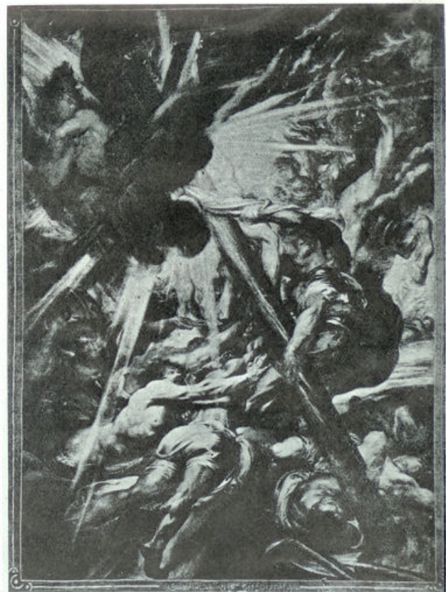
„De Phare de Golgotha”