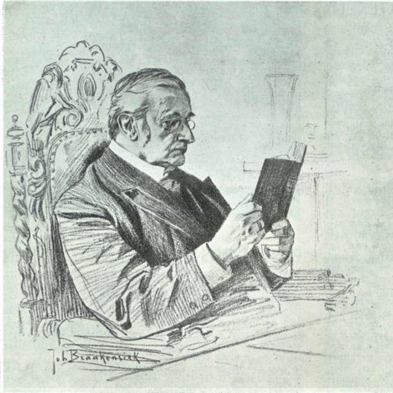
Naar een tekening van Braakensiek