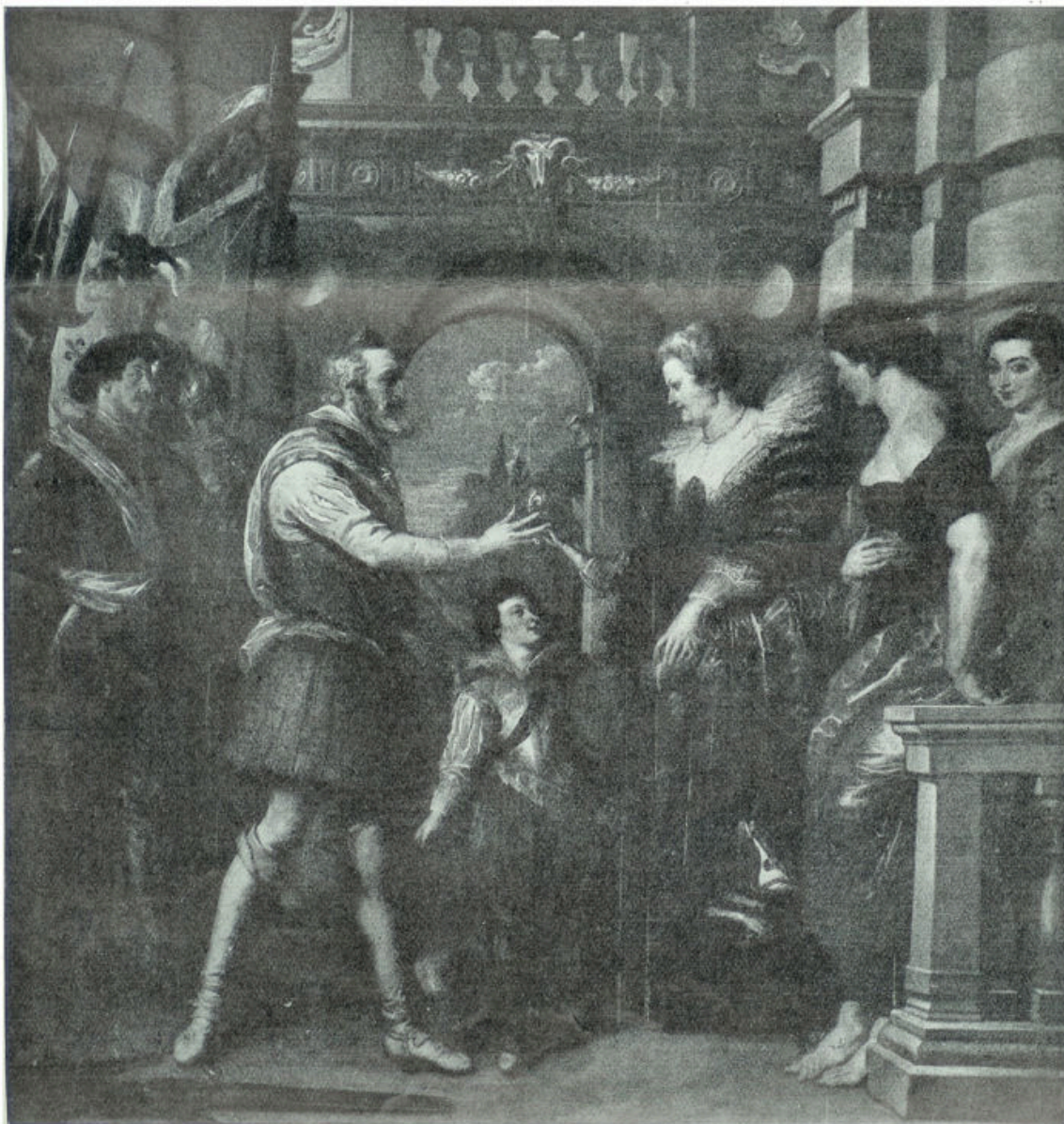
Naar een schilderij van Rubens