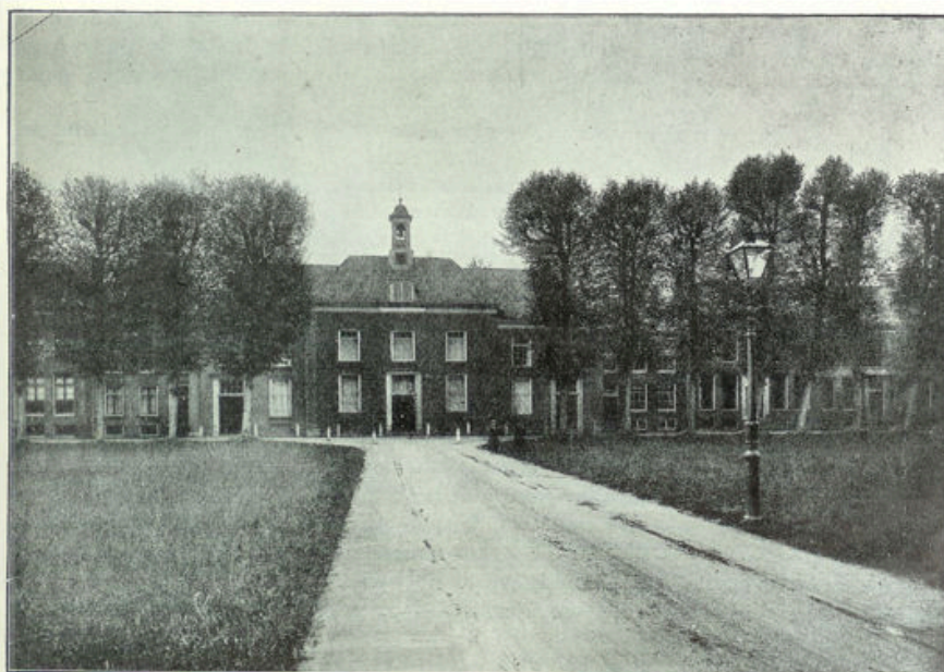
Het kerkgebouw van de Broedergemeente te Zeist, waarin de officieele feestviering plaats vond.