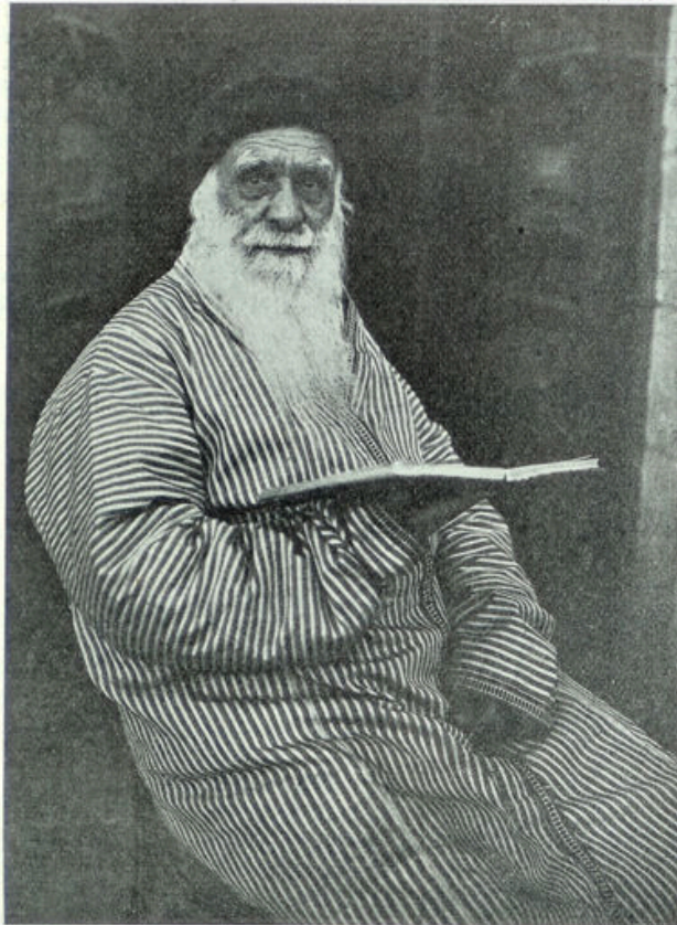
Oude Boelgaarsche Jood