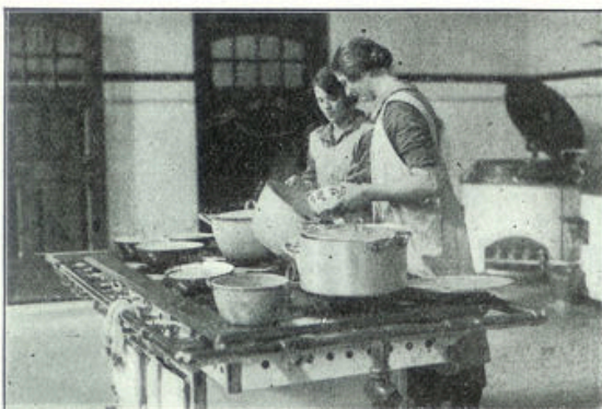
In de keuken

Jongens- en meisjesverenigingen zijn goed bevolkt en aangesloten bij de bonden, — en dan niet te vergeten de sport; de trots van Neerbosch is het prachtig zwembassin, geschenk van oud-weezen aan Ds Kluin; men