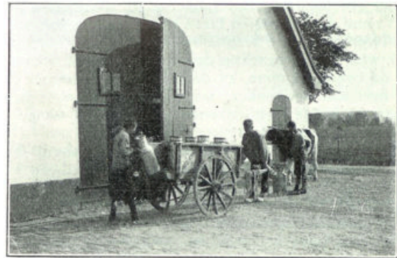
Achter de tegenwoordige boerderij

Twee verpleegsters zwaaien er den scepter: wie ziek is, blijft niet op de slaapzaal te bed, maar wordt opgenomen. Een dokter en een tandarts uit Nijmegen komen geregeld naar Neerbosch. Er is aan alles gedacht!