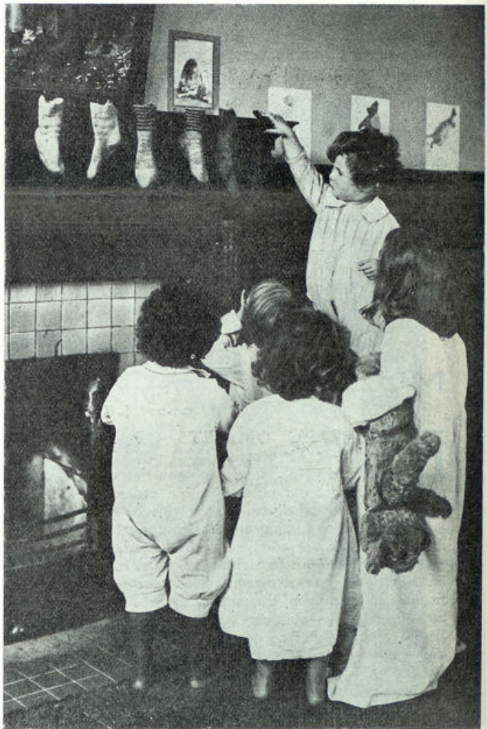
In ons land wordt meestal tegen 'St. Nicolaas de schoen klaar gezet, waarin de goede bisschop zijn gaven kan neerleggen. De Engelsche kinderen hangen hun kousen boven den schoorsteenmantel, vol verwachting, wat ze den volgenden morgen zullen inhouden.

En, wanneer we dat beleven, zouden we dan ook niet tot de erkenning komen, dat het Goddelijke en het schoone zeer dicht bij elkaar zijn, ja feitelijk één Bron is?