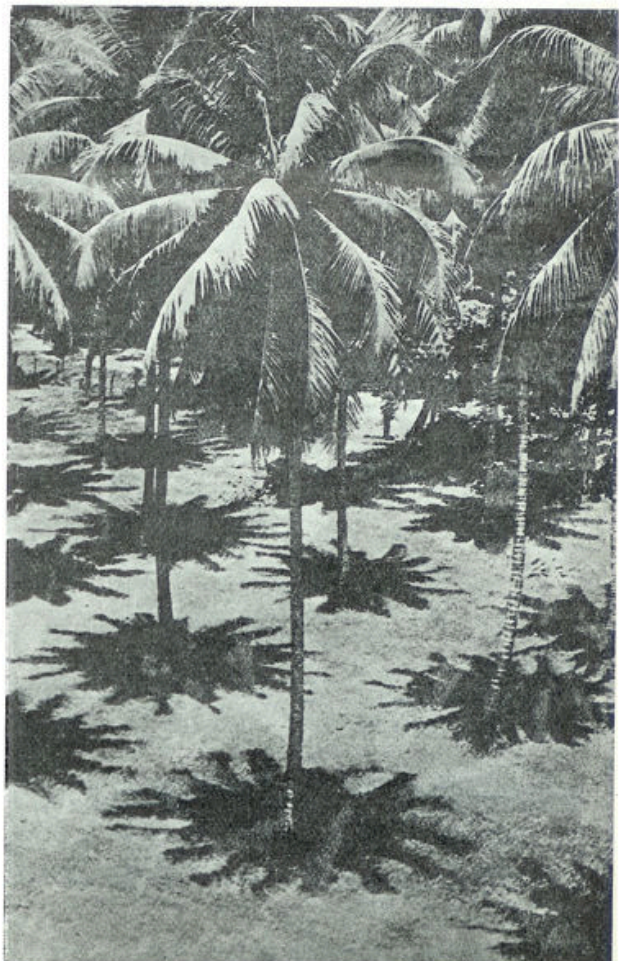
Een merkwaardige foto, genomen op het midden van den dag in Tahiti (Polynesië), waar de schaduwen loodrecht vallen en de palmbladeren zich als sterren op het witte zand afteekenen.

Schrijven is zaaien! Het komt op het innerlijk leven van een auteur aan, of hij een vloek of een zegen zal brengen.