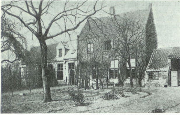
Achterzijde van Gezelle's geboortehuis.