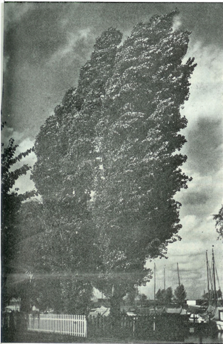
Herfststemming aan den Kralingschen Plas.