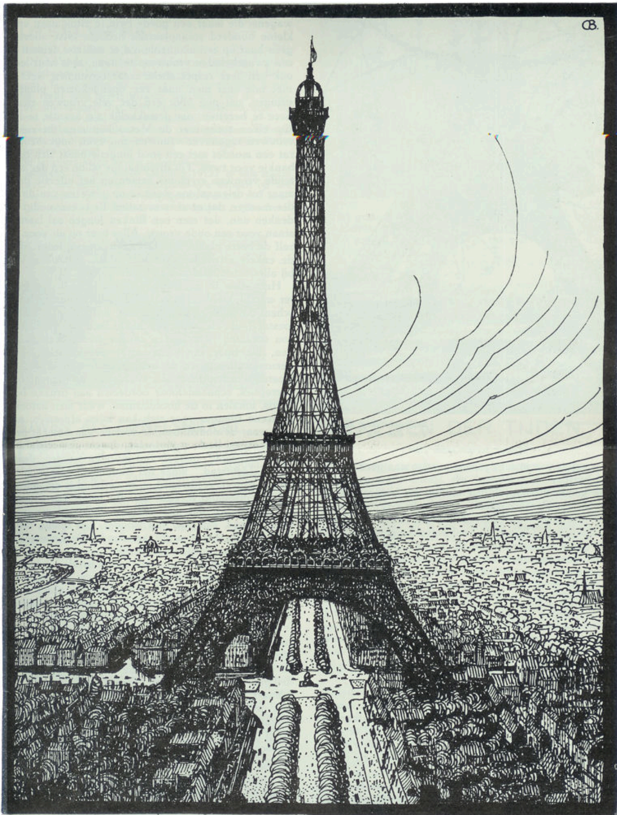
Naar een tekening van Co Brandes