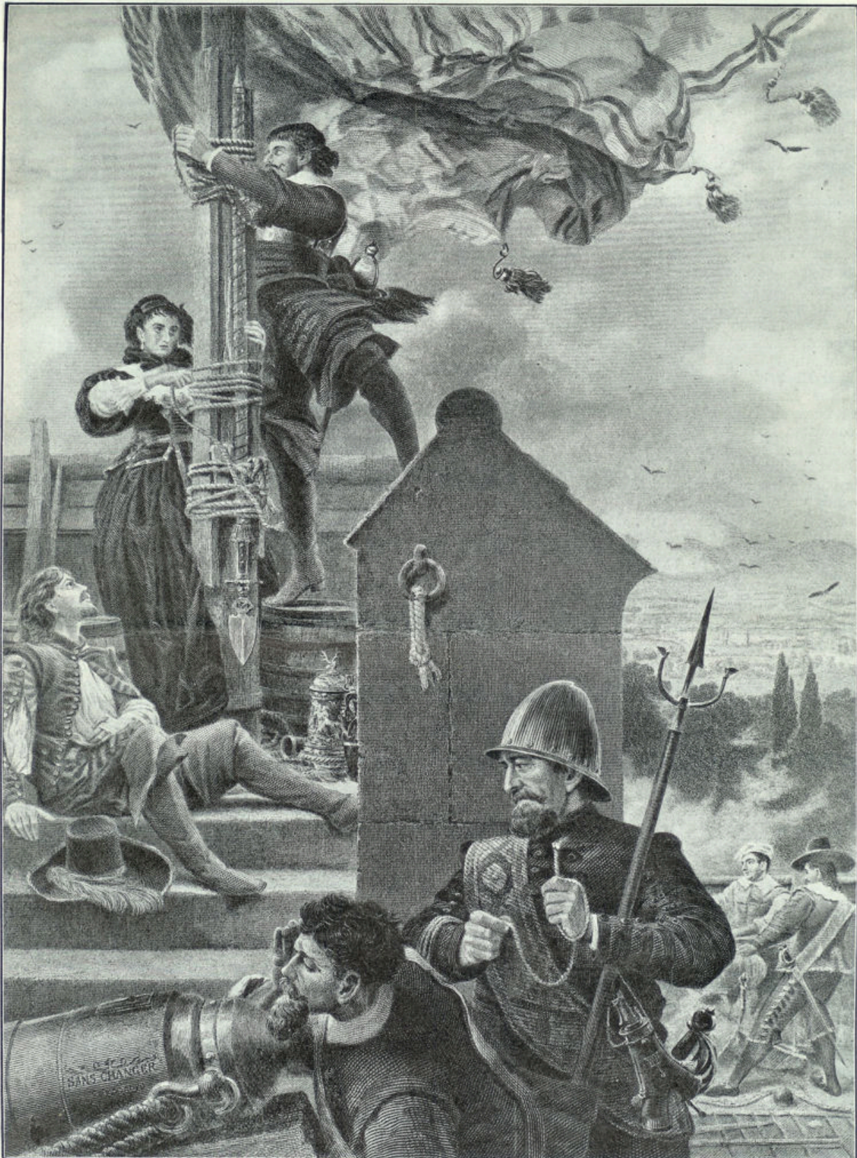
De gravin van Derby bevestigt met eigen hand de koninklijke banier op het kasteel Latham-House in Lancashire, dat door Fairfax wordt aangevallen. (Tijd Karel I.)